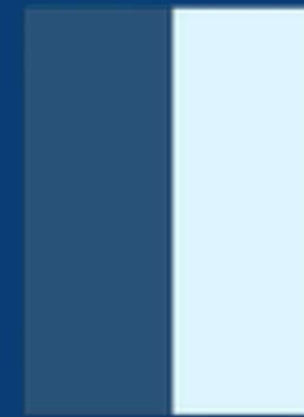
Media página v